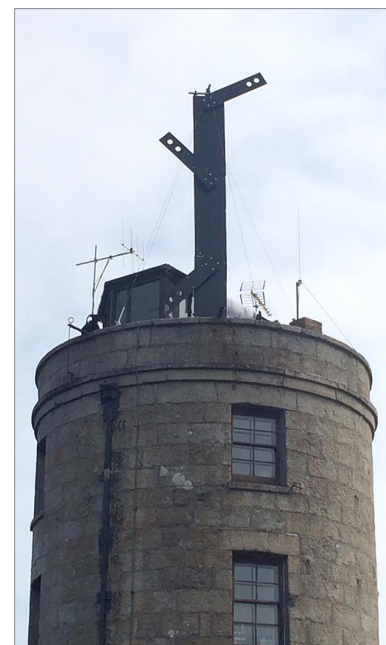
Der optische Telegraf auf der Turmspitze

Andreas Hahn, DL7ZZ Schneeheide 22 29664 Walsrode Tel. (0 51 61) 4 81 09 74 dl7zz@darf.de