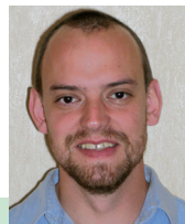
Beiträge für „Pile-Up“ an: